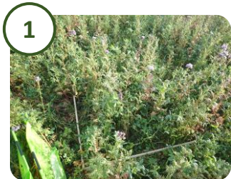
1 Délimitation d'une zone de 1m 2 choisie aléatoirement. Etape à réaliser 3 fois.