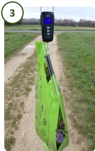
3 Pesée de chaque espèce