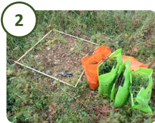
2 Coupe et tri des différentes espèces du couvert